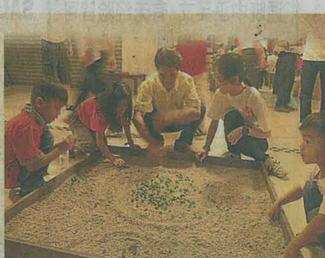
▲弹玻璃珠是许多人童年的美好回忆。