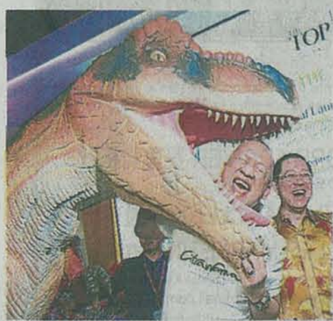
▲纳兹里(左)代表副首相为The Top主持开幕礼，他说他玩得很开心；旁为林冠英。

林冠英(左起)和纳兹里手牵手，体验走在东南亚最高空中走道(位于光大第68楼)上的感觉，由行动党国会领袖林吉祥及其他嘉宾陪同。