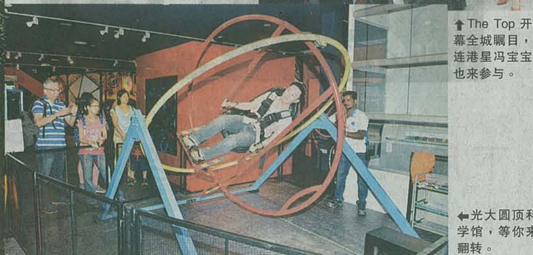
The Top 开幕全城瞩目,连港星冯宝宝也来参与。