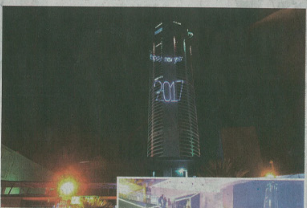
▲留守在檳城倒數的公眾及來自世界各地的遊客, 肯定都留下了一個難忘的跨年夜。